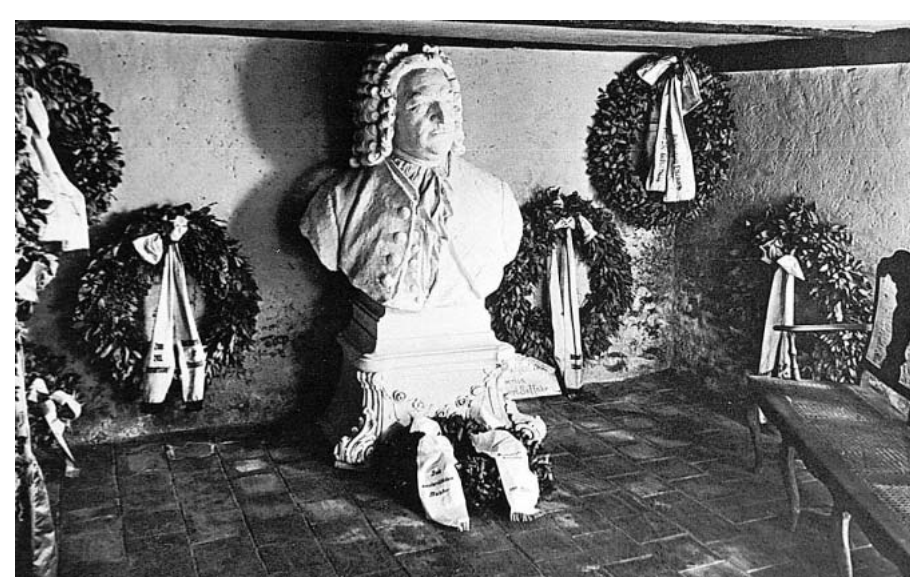
Unsterblicher Meister: Johann Sebastian Bach mit Andachtsbank (1930)